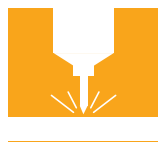
GRAVERING AV STEIN/MARMOR