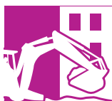
BYGG OG ANLEGG