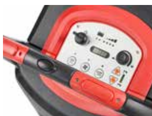
Panou de control cu afișaj intuitiv