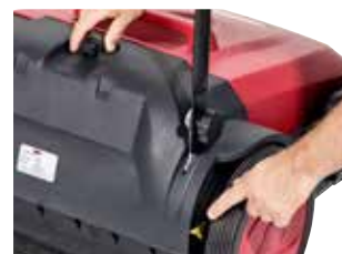
Perie principală ajustabilă