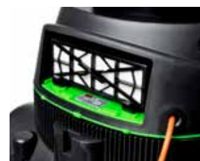
Configurația standard conține filtrul HEPA