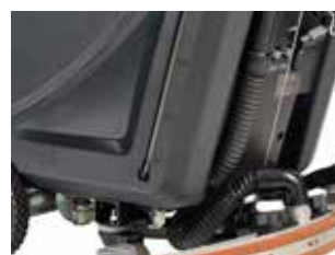
Indicator de nivel al apei pe rezervor