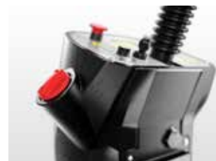
Deșurubați capacul roșu și umpleți cu apă