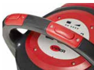
Comutator de siguranță integrat ergonomic. Fiecare comutator poate fi acționat independent