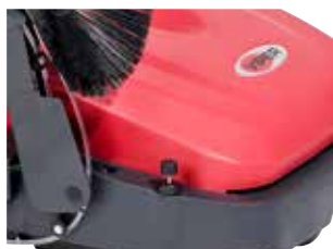
Ajustarea periei principale