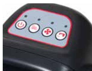
Panoul de control cu 4 functii usor de folosit