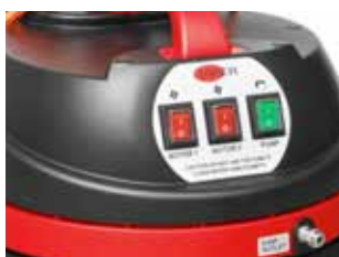
Acționare cu o singură apăsare pentru ușurință în utilizare