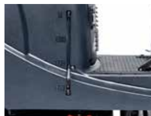
Indicatorul de nivel al apei vizibil pe rezervor