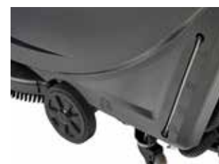
Ușor de utilizat și transportat datorită roților mari care echilibrează mai bine echipamentul