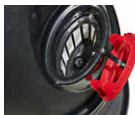
Alimentarea cu apă se face prin deschiderea ovală mare cu filtru și capac de protecție