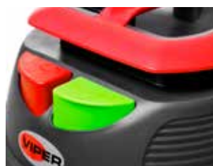
Buton ECO pentru a regla puterea de aspirație și a reduce zgomotul