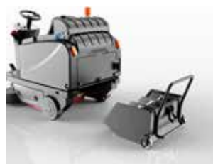
Container cu roți, opțional cu 3 mini-containere