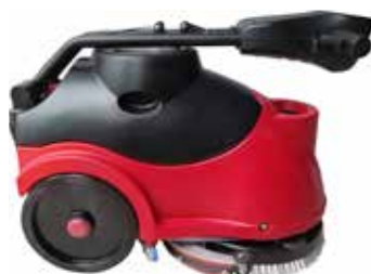
Maner pliabil pentru o depozitare usoara