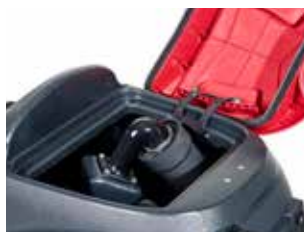
Deschiderea largă a bazinului de recuperare de 73 de litri îl face ușor de curățat