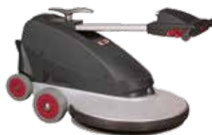
Mâner pliabil pentru o depozitare ușoară, economie a spațiului și ușurinta în transport