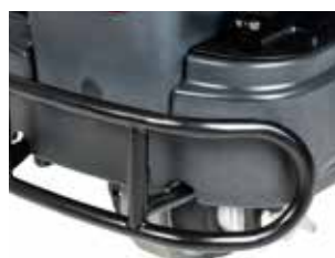
Bara de protecție frontală, protejează aparatul și îi asigură echipamentului o durată de viață mai mare