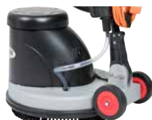
Puteenic, motor robust și roți mari pe spate pentru transport facil