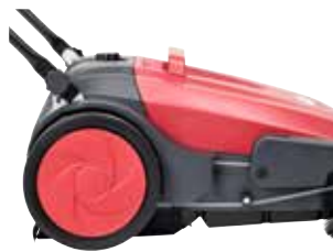
Roți mari ce nu lasă urme