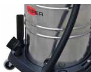
Stocarea ușoară a accesoriilor