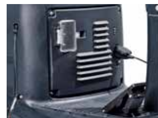
Incarcator integrat pentru o usoara alimentare a bateriei