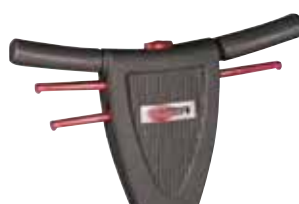
Mâner ergonomic, reglabil pe înălțime cu, comutator de siguranță pe centru, ușor de utilizat