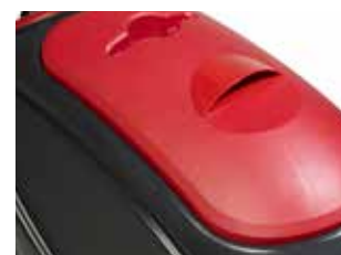
Curățarea simplificată a rezervorului de recuperare, datorită capacului mare al rezervorului