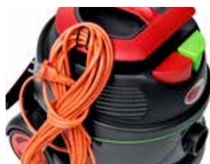
Support cablu pentru o depozitare ușoară